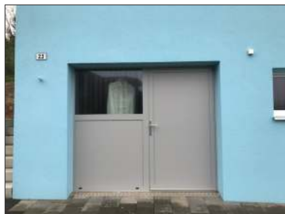
Rothrist AG Umnutzung Garage