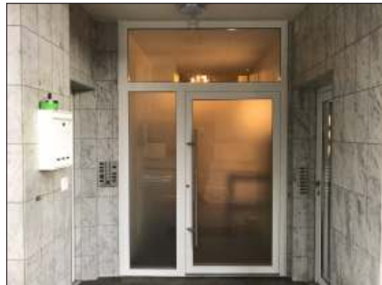
Objekt: Olten SO Eingang MFH