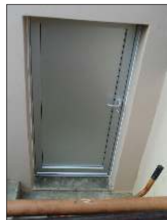
Solothurn SO Kellereingang