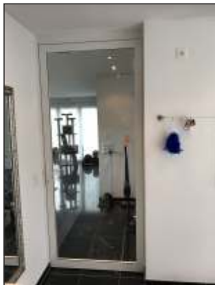
Objekt: Kölliken AG Innenraum