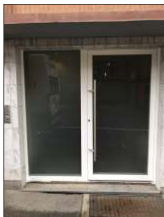
Olten SO Eingang MFH