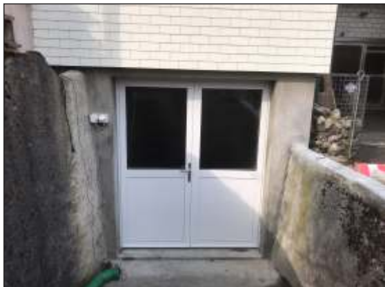
Objekt: Dulliken SO Umnutzung der Garage