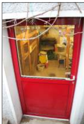
Murgenthal BE Hobbyraum