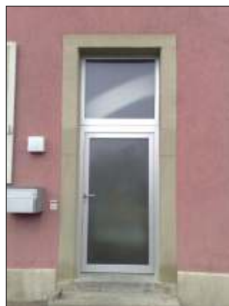
Unterentfelden AG Haupteingang