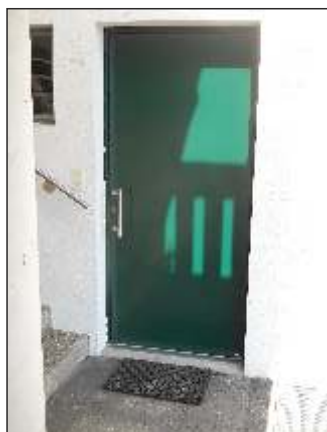
Zürich ZH Nebeneingang