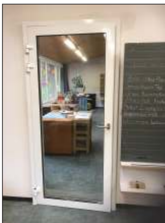
Objekt: Muri AG Schulhaus Innen